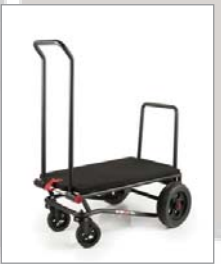
AMG 250 mit optionaler Auflage