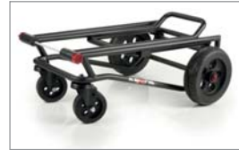
Flacher Transportwagen mit vier Rollen