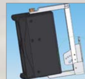
Oben: U-Bügel für PF10+ MK II